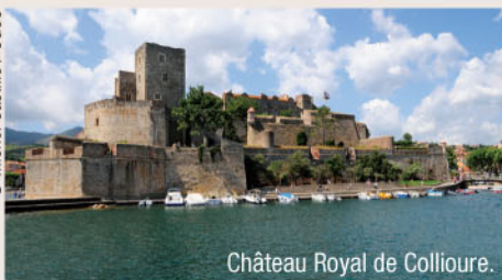
Château Royal de Collioure.