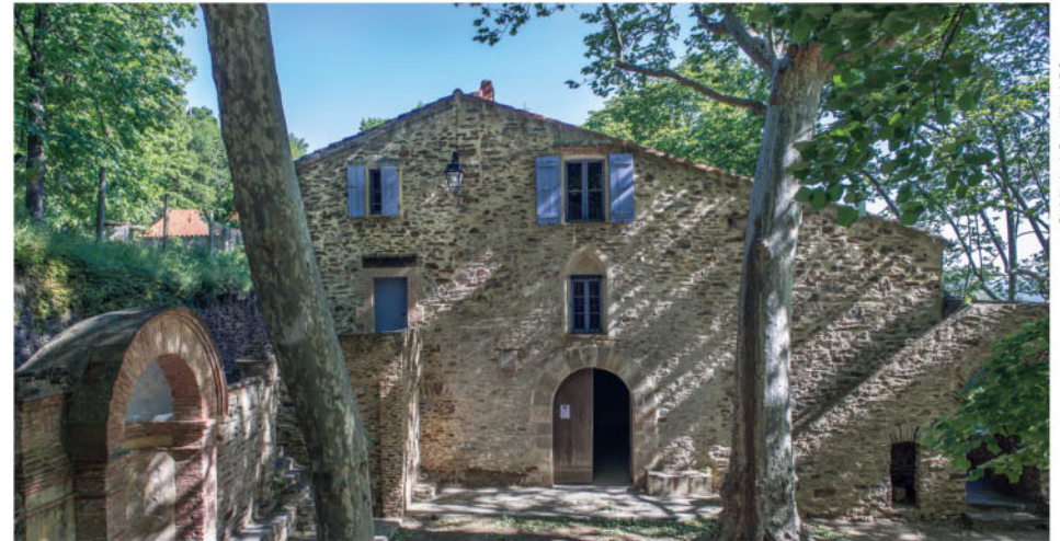
Sur le chemin, l'ermitage de Notre-Dame-de-Consolation.